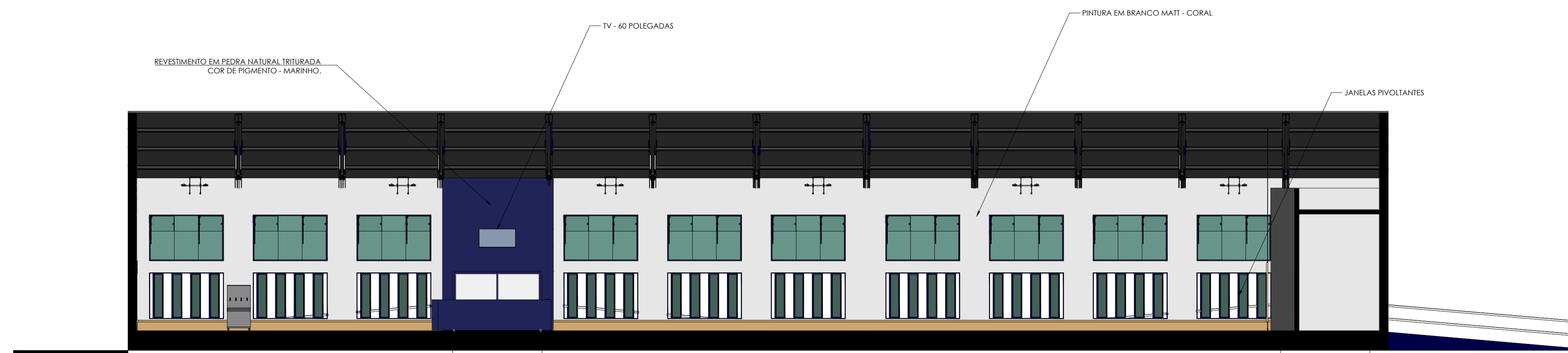
17 CORTE EE